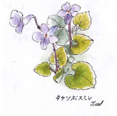
タチツボスミレ (2014年4月)