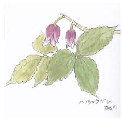
ハンショウヅル (2014年5月)