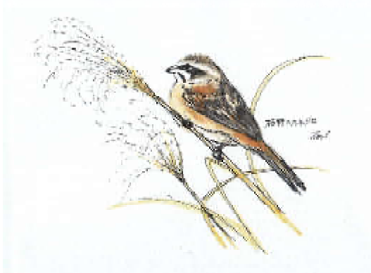
枯野のホホジロ (2014年2月)