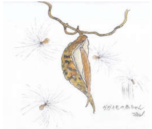
ガガイモの赤ちゃん (2014年3月)